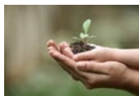
PROTECCIÓN DE PLANTAS